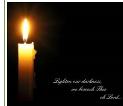
Lighten our darkness, we beseech Thee, O Lord...